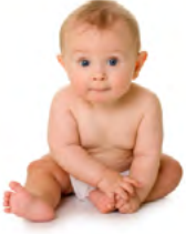
Tek başına oturma